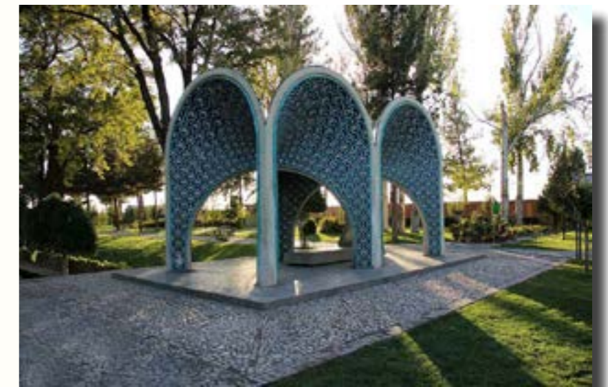
La tumba de Kamal-ol-Molk