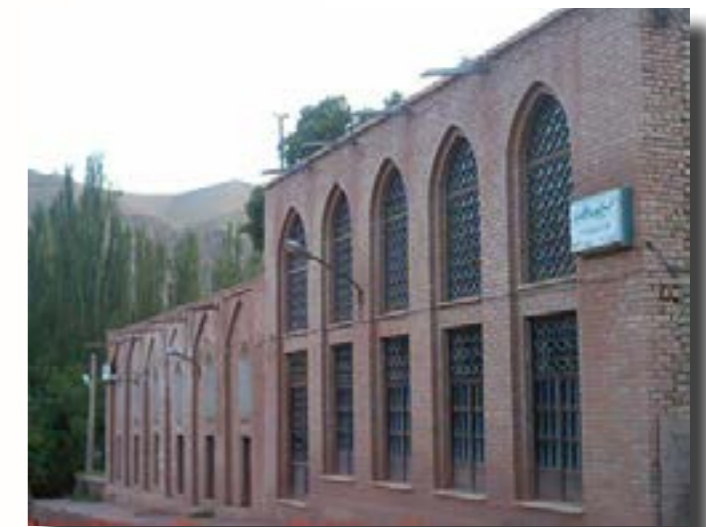
La Mezquita de Haajatgaah de Abyaneh