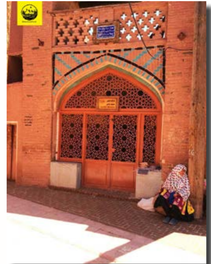
La Gran Mezquita de Abyaneh

La tercera mezquita es la de Porzaleh, que data del siglo XIII y es, quizá, la más imponente. Amplias salas (shabestan) y techos