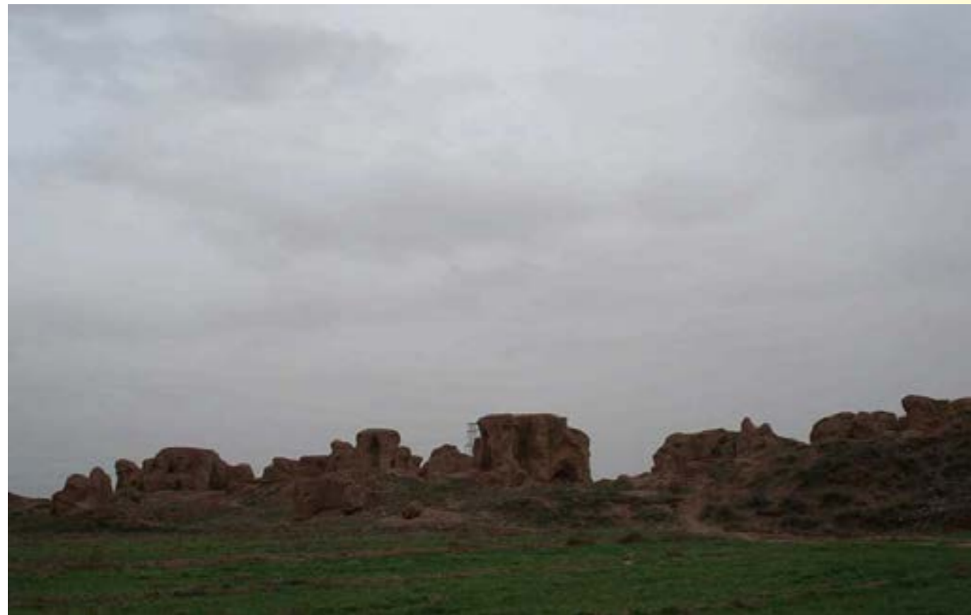
Los restos de la ciudad antigua Neishabur

Cabe mencionar que Neishabur es la cuna de los destacados personajes científicos y culturales tales como el Jeque Attar, gran místico, Omar Jayyam, el gran sabio, matemático y poeta y, también Kamal al-Molk, el gran pintor.