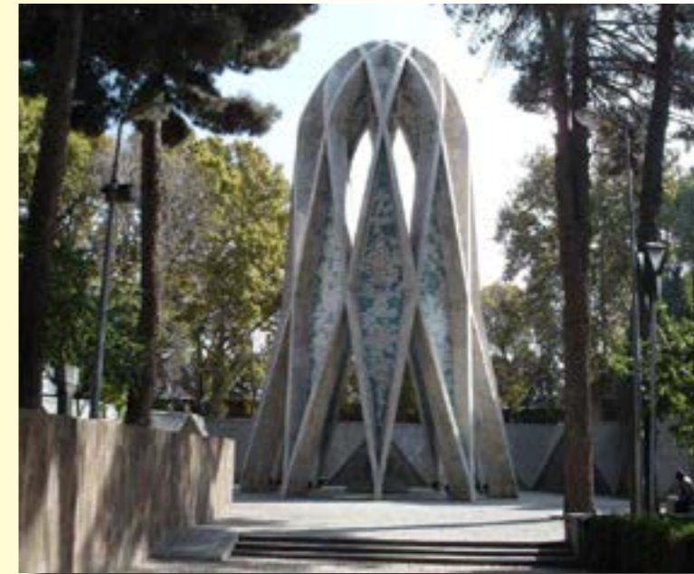
La tumba de Omar Jayyam