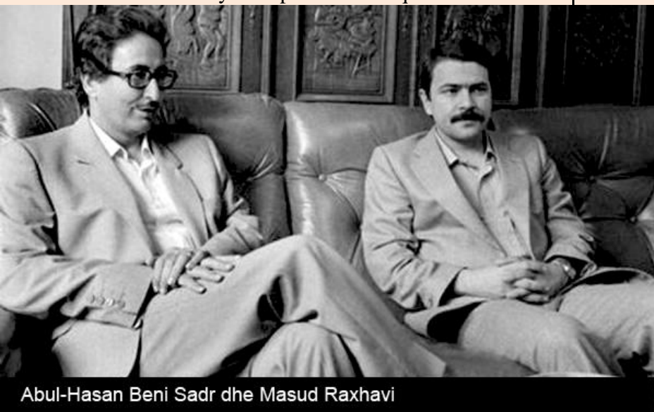
Abul-Hasan Beni Sadr dhe Masud Raxhavi